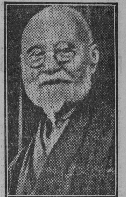
El ministro Takahashi, víctima de la sedición militar que durante varias horas fué dueña de parte de Tokio.