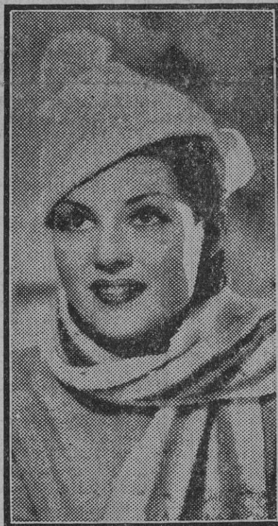
Reciente retrato de la bella y joven artista de la pantalla Rita Cansino.