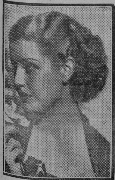
Anita Louise, joven estrella del cinema americano.

El teniente de alcalde, señor Giménez de Aragón, tuvo una buena idea que no dudamos un momento en elogiarla. Y creíamos que á todos los sevillanos le parecería también plausible y beneficiosa, en cuanto podía contribuir al mejoramiento del ornato de Sevilla. Los monolitos que pasaban inadvertidos, irguiéndose en el rincón de un solar de la calle Mármoles, se trasladarían á la Alameda de Hércules, y en el sitio más adecuado—todavía