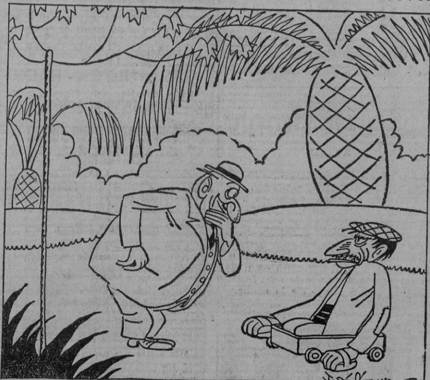
—A mí me gusta pasear por aquí para respirar el aire puro... El otro (distruido).—¡Ya, ya! Y para estirar las piernas, ¿eh?

noticia del fallecimiento del duque de Veragua, ocurrido á las nueve de la mañana.