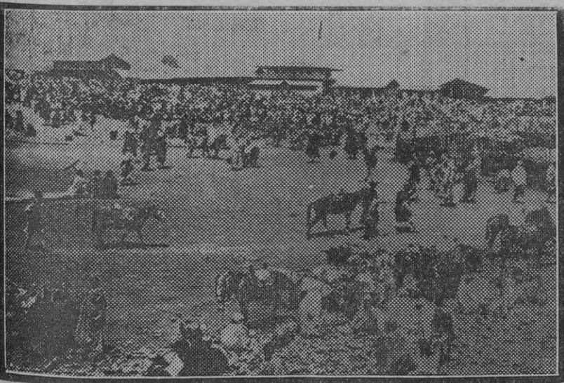
Una vista general de una plaza de Addis Abeba, capital de Abisinia, centro de concentración de las fuerzas del Negus que pelean contra Italia. (Fdo. Gori.)

Berlín 16.—El Gobierno americano ha encargado á la industria alemana diez dirigibles semirrigidos de 20.000 metros cúbicos cada uno.