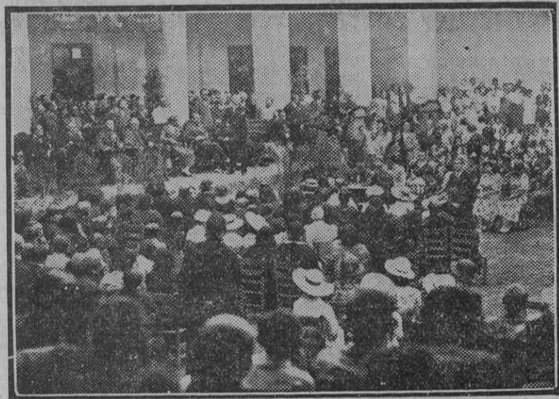
Aspecto del patio durante el acto de inauguración de las Escuelas Salesianas de Triana.

El tema merecerá insistir en otras ocasiones.