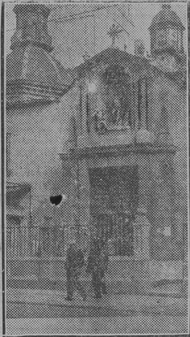
Iglesia de San Sebastián, en la que fué enterrado Lope de Vega.

Exaltación de su ser cuando trabaja, cuando apartado en el grato refugio hogareño, sobre blanco pliego y á la luz del candelabro, solo con sus pensamientos, con sus ambiciones, aquello