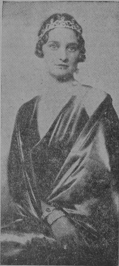
La reina Astrid de Bélgica, que falleció a consecuencia del accidente

Lucerna 29.—El accidente que ha costado la vida a la reina Astrid ocurrió a eso de las diez de la mañana.