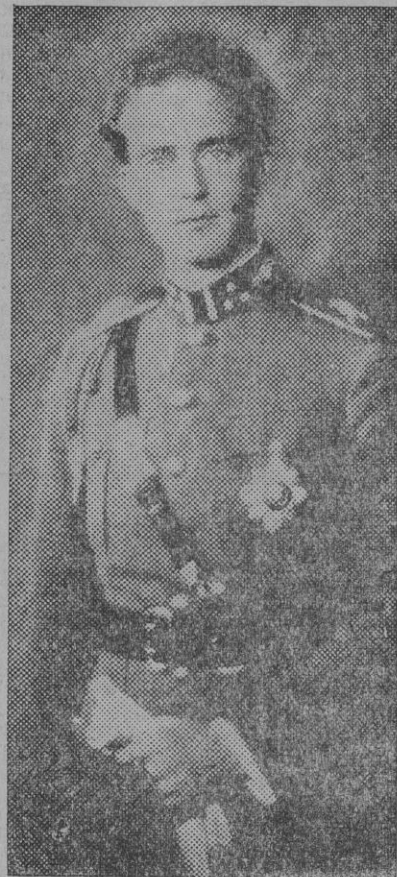
El rey Leopoldo, que conducía el auto en el momento de producirse el accidente

A los primeros momentos de excitación sucedió un abatimiento general. Las mujeres lloraban y los