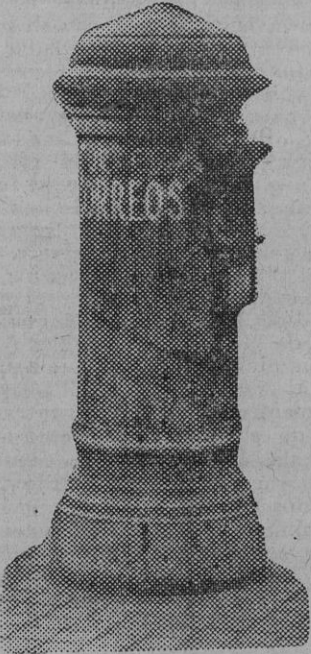
Y el buzón...