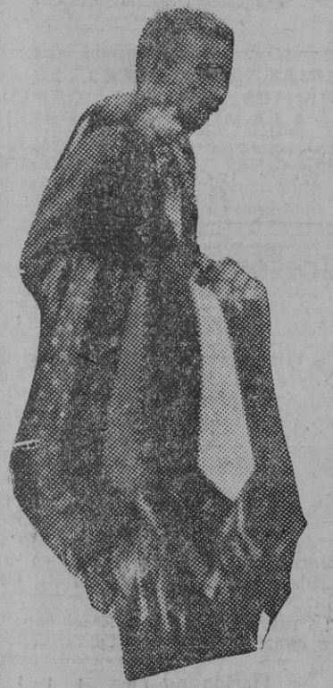
El vendedor de corbatas, silueta muy vista en las calles sevillanas. ¿Quién no ha sido víctima de su feroz acometida?