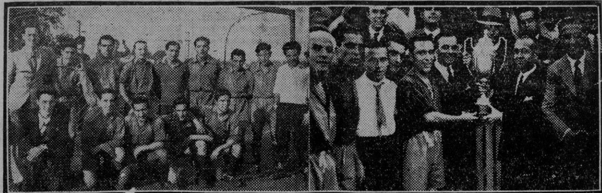
El equipo del España F. C.—Entre ga de uno de los trofeos oficiales ganados por el España F. C.

legramas de Valladolid sobre la detención de un anarquista apellidado Moja, al que se le atribuía el propósito de atentar contra la vida de don Alfonso al paso del sudexpreso que lo conducía á Segovia. El ministro de la Gobernación quitó importancia al suceso, diciendo que no estaba comprobado que el detenido tuviera los propósitos que se le atribuían y que acaso se tratara de un exceso de celo de las autoridades de Valladolid.