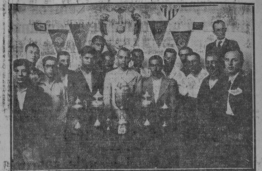
Directivos y socios del España F. C. con los trofeos ganados por el equipo.