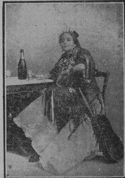
Una auténtica flamenca de aquellos días

Una de las noches en que las pasiones se hallaron más enardecidas, Frasuelo mandó cerrar las puertas de El Burrero cuando más gente lo llenaba, pagando los gastos que se hicieran por