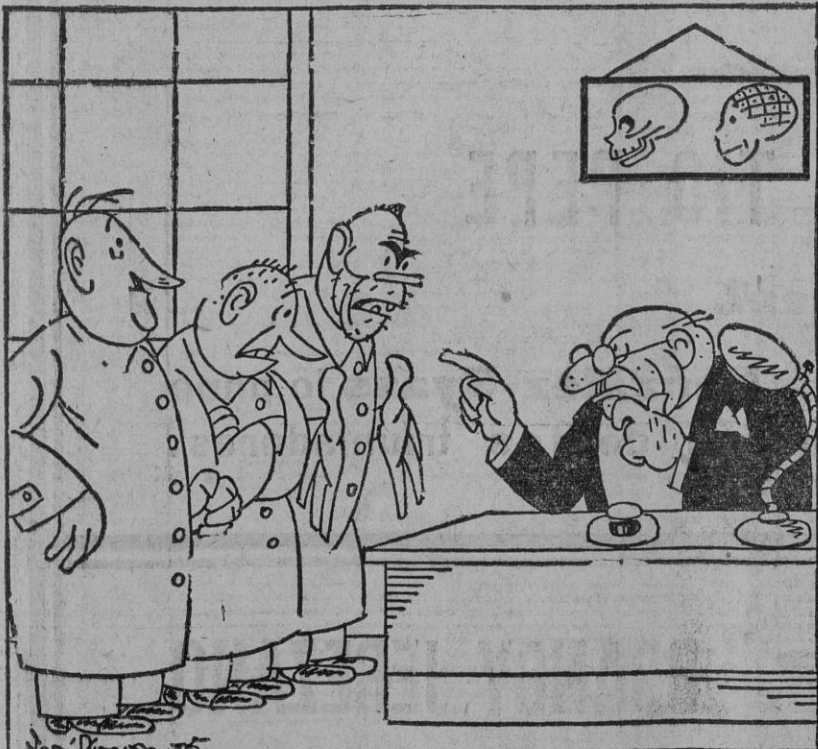
EN UN MANICOMIO.—Los que llamados para decirles que los locos se quejan de que ustedes tres les dan muy malos tratos: —Señor director, ¡los locos se quejan sin razón!

En la presente semana aparecerán las primeras informaciones de estas visitas de EL LIBERAL á las peñas, centros y casinos de barrios.