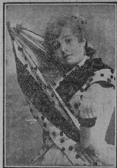
Esto era una mujer fatal de finales del siglo XIX