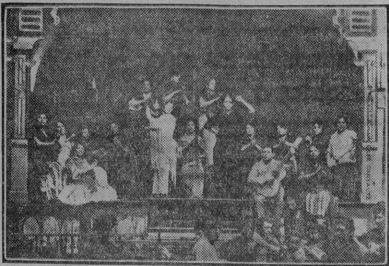
Un viejo café cantante