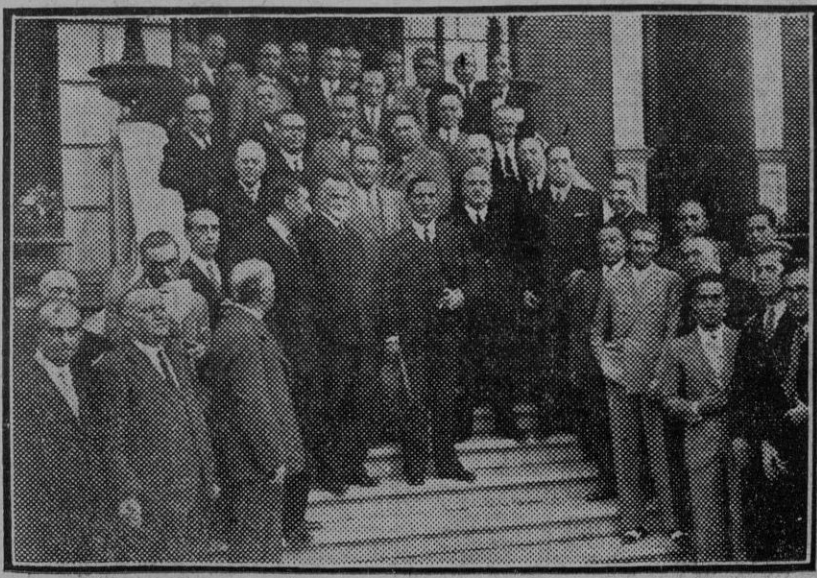
MADRID.—Acto inaugural de la Escuela Oficial de Telecomunicación, presidido por el ministro del ramo.

Con una potencia superior de 25 mil caballos a la del paquebot francés, se espera que el «Queen-Mary» podrá navegar a la velocidad de 32 nudos a la hora.