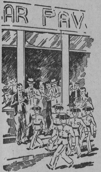
En un bar situado cerca del teatro...

ciclos militares, juegan con un fusil en vez de con un balón, y les hablan de usted, como si fueran nombres hechos y derechos. Pasada la Semana Santa desfilaron una tarde los civilitos por la calle Tetuan, ante la admiración de todos. Las ovaciones se sucedían. Los niños-guardias, poseídos de su papel, rehusaban algunos regalos que les ofrecían los entusiastas. En un bar situado cerca del teatro, donde se reúnen toreros, cómicos, peletaris y artistas flamencos, comentaban con grandes elogios el desfile de los niños de Valdemoro.