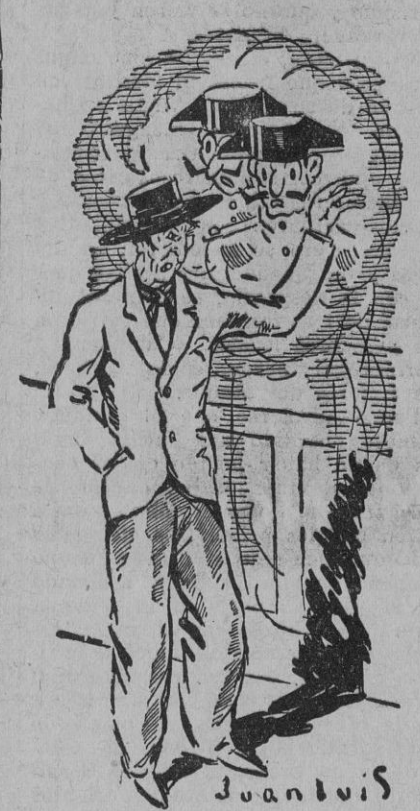
—Lo malo es que crecen!...

—¡No dices ná, Miguel? —¡De qué? —De los civilitos. —¡Y qué vía deci yo! —¡No te ha gustao el desfile! —No ha estao mal. —¡Cómo mal! ¡Superió! ¡Has vis-