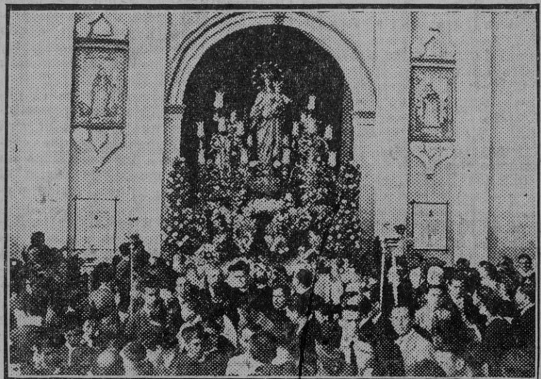
La procesión de María Auxiliadora al salir de la iglesia de la Trinidad.