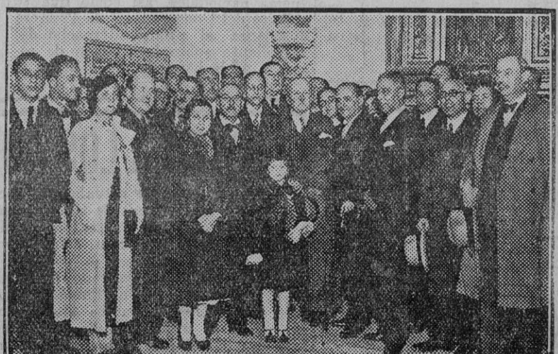
Los miembros del X Congreso visitando la tumba de Bécquer en la iglesia de la Universidad.