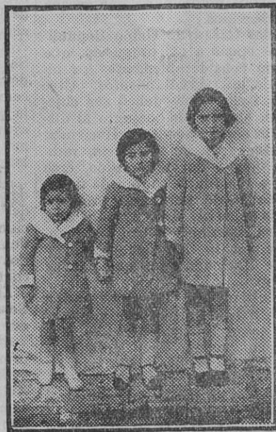
Las tres hijas de la víctima

bajosamente. Su entrada por la calle Real se hacía imposible, así como en el Ayuntamiento. Al llegar a casa de los padres políticos del finado era imposible dar un sólo paso y tuvo la fuerza pública que despejar. Miles de personas le acompañan después hasta el cementerio; durante el trayecto no se oyeron más que palabras de condenación para los minales. El entierro terminó muy cerca de las diez de la noche. Ahora sólo queda una pobre mujer, con tres hijas, la mayor de siete años, al amparo de las almas cristianas que quieran acudir en su ayuda. Esta ha quedado en la mayor miseria, pues hasta lo poco que po-