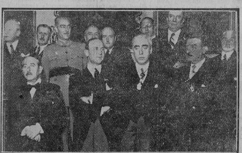
Presidencia del acto celebrado ayer en la Universidad en homenaje a la memoria de Lope de Vega.