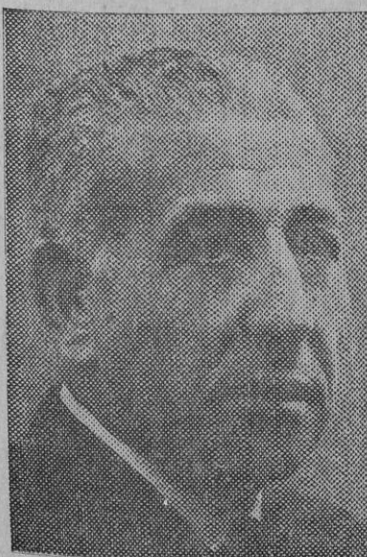
Señor Velayos, ministro de Agricultura.