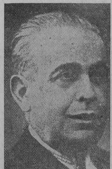
Señor Chapaprieta, ministro de Hacienda.