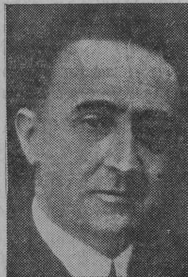
Señor Casanueva, ministro de Justicia.