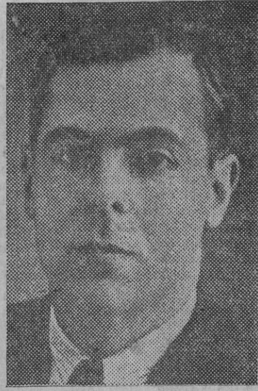
Señor Salmón, ministro de Trabajo.