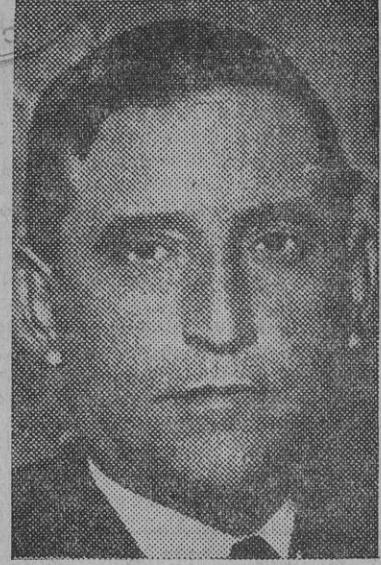
Señor Lucía, ministro de Comunicaciones.