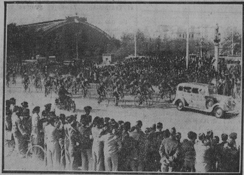
MADRID.—Salida de la Puerta de Atocha de los corredores que toman parte en la I Vuelta Ciclista á España. (Fdo. Gori.)