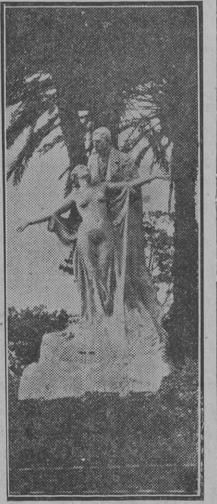
Monumento á Eça de Queiroz en Lisboa.