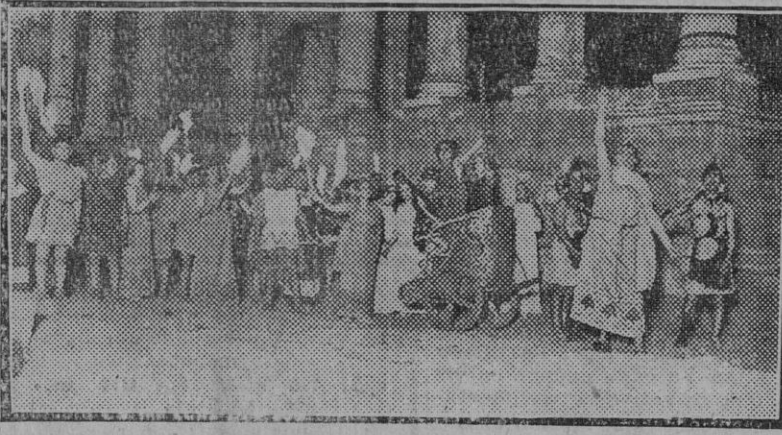
Escena final de «Medea».

Un acierto de buen gusto ha hecho surgir maravillosamente en las vetustas ruinas del Teatro Romano de Mérida la animación escénica dormida durante siglos, recobrando como por arte encantador de bella magia el lucimiento coreográfico y el vibrar dramático de la farsa, retrotrayendo al espectador a tiempos pretéritos, impresionándolo con el sabor ple-