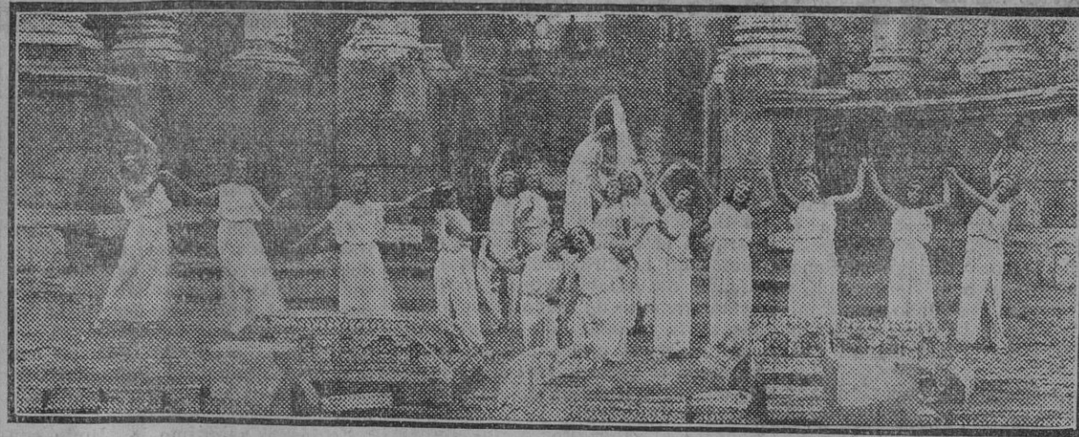
Semana romana.—Pavana de Foret.

Un acierto de buen gusto ha hecho surgir maravillosamente en las vetustas ruinas del Teatro Romano de Mérida la animación escénica dormida durante siglos, recobrando como por arte encantador de bella magia el lucimiento coreográfico y el vibrar dramático de la farsa, retrotrayendo al espectador a tiempos pretéritos, impresionándolo con el sabor ple-