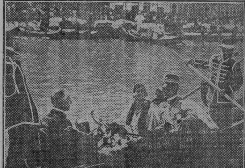
El príncipe Humberto de Italia y su esposa, la princesa María José—quien, como se sabe, se encuentra próxima a ser madre—han hecho un viaje a Venecia, en donde el pueblo les ha tributado un gran recibimiento. He aquí a los herederos del Gran Canal.