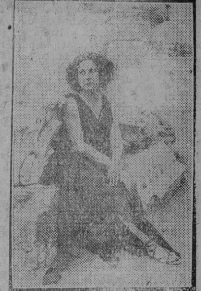
La Xirgu en «Elektra».

Su poder nos arrancó del presente por unos momentos; teatro y representación hicieron la magia de resucitar milenariamente tiempos pasados perennemente recordados por el valor de su sabiduría, impercederos en la cultura, base de todo el progreso, en cuya civilización están las fuentes madres de nuestro orgullo de hombres modernos, de aquella seriedad apoteósica, de aquella reciedumbre de edificio y de poder en la escena a nuestro teatro de papel y madera, de temas banales y actores amanerados, oropel de luz y fantasía, inconstancial y sin