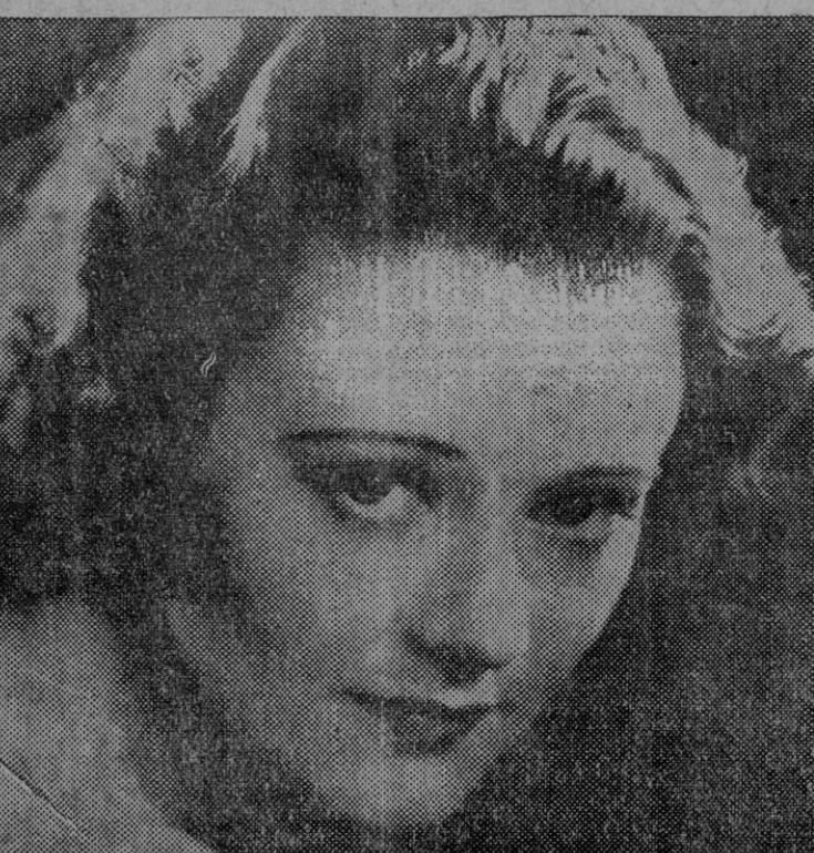
La joven y guapa actriz del cinema americano Heather Angel.