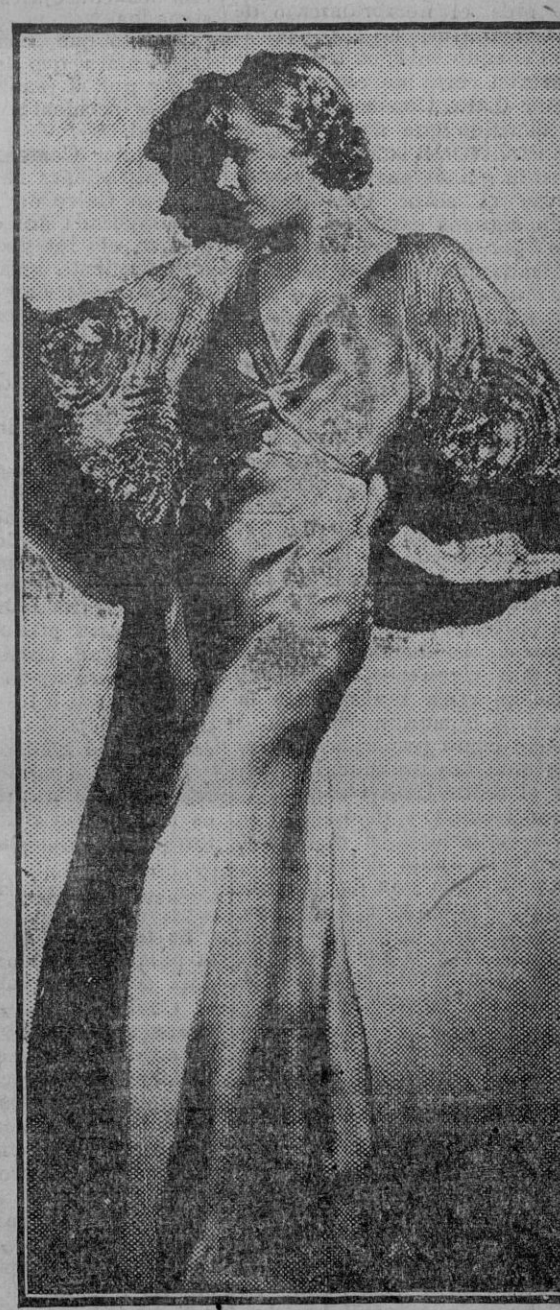
June Knight, una de las más elegantes actrices del cine americano