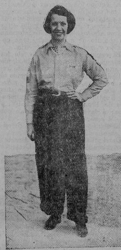
«giri» norteamericana, con un tonto de distinción europea.

Sin embargo, el «Zeppelin» trae siempre algo. Comienza ahora a dibujarse la estampa novelesca del «Zeppelin». El público no quiere limitarse a contemplar el paso tranquilo y orgulloso del lujoso puro con su envoltura de plata. O del casco guerrero, que con muy buena voluntad vea en él, al enfilarse de proa, una de nuestras primeras y más simpáticas autoridades.