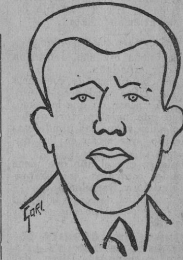
Gori, visto por Gori

En Madrid colaboró en «La Libertad» en unos apuntes de la vida chulapona de verbenas y barrio: Manolo encierra el coche en la Cruzada, con la muerte en vida de sus farolas de gas y la cortesana fernandina de los alabareros. Julián y la de la calle del Rollo en los caballitos y en el simón de gran mantón de flores y auriga clásico. Puestos de churros. Alhambra de San Juan. El Prado. La Pradera. La Paloma. San Antonio de la Florida, adonde bajó mi niñez de aro y escolaridad bajo