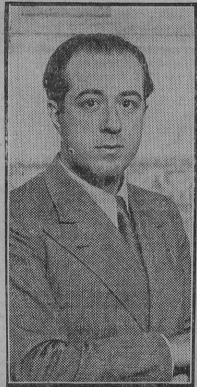
—En Sevilla es realmente trágica. El Conservatorio solucionará en un momento por ciento este pavoroso problema. Además, la subvención conseguida para la Filarmónica y el indudable resurgir musical que se ha de producir terminarán con los parados. Nosotros haremos todo lo que esté dentro de nuestras posibilidades.

—Se inaugurará en Octubre. ¿Proyectos? ¿Si me queda tiempo...? J. L. Gómez Tello.