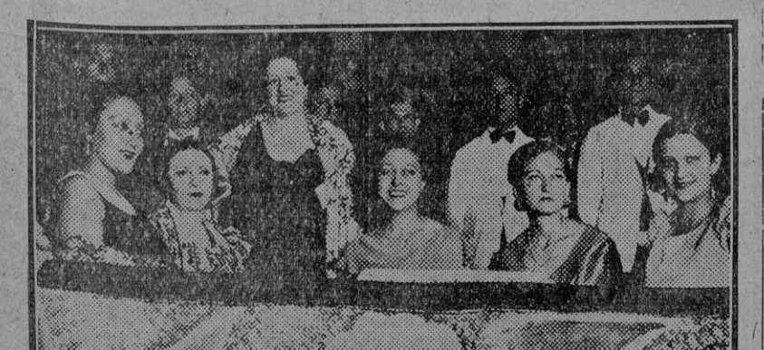
En el Circo de Price, de Madrid, con vertido en fantástico jardín, se ha celebrado con extraordinaria animación la verbena de las actrices. La foto muestra un palco ocupado por destacadas artistas. (Fdo. Gori.)

Nada, todavía, de Comisión gestora : : : : : A otras alusiones periodísticas, relacionadas con posibles designaciones de nuevos gestores municipales, contestó el señor Asensi diciendo que no habiendo é l resuelto aún el escrito de los concejales de Acción Popular, en que se solicitaba una inspección gubernativa al Ayuntamiento, cuanto se hablara no dejarla de ser fantasma.