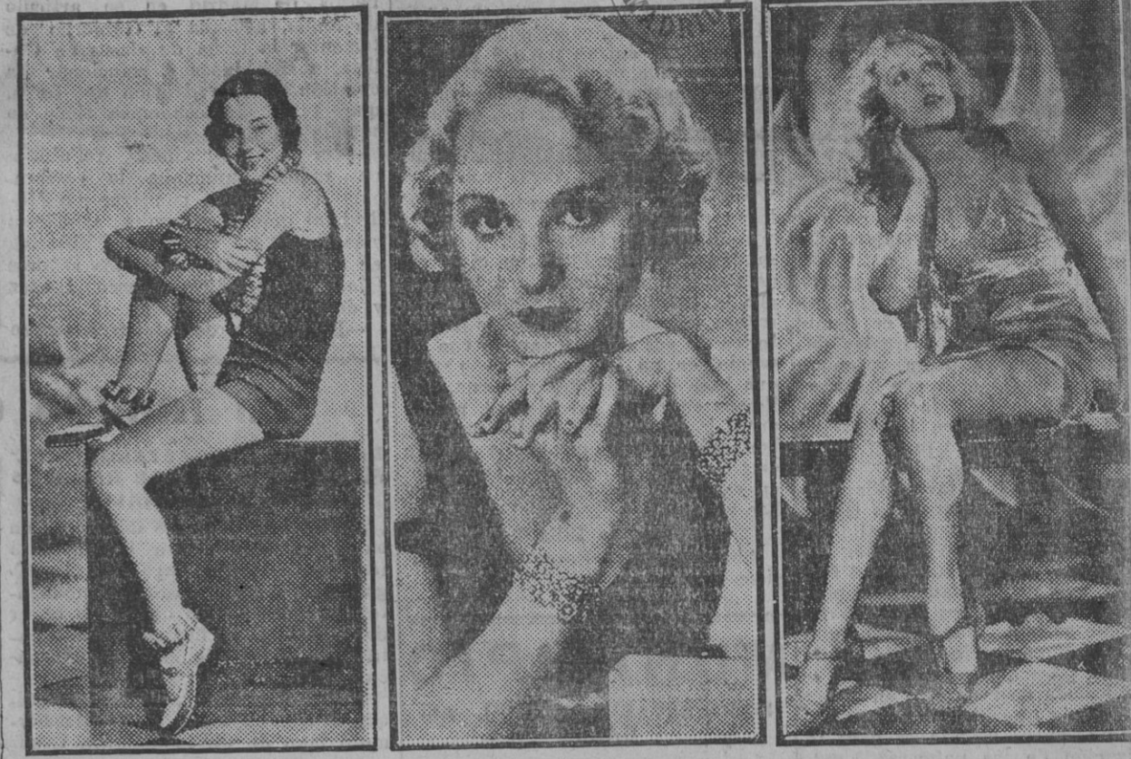
Estrellas de la pantalla: Maureen O'Sullivan, Leila Hyams y Fay Wray.