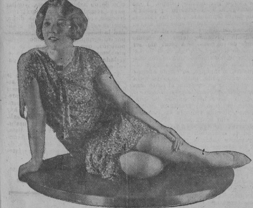
Dorothy Mackail, la precoz bailarina de las piernas desnudas.