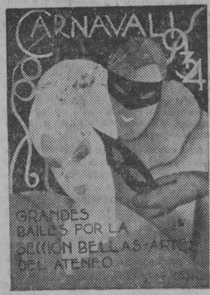
Cartel anunciador de los bailes organizados para Carnaval por la sección de Bellas Artes del Ateneo