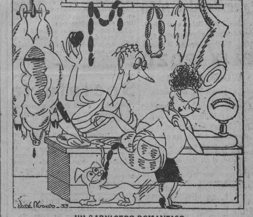
UN CARNICERO ROMANTICO

—La amo á usted con locura! Tenga la seguridad de que no le engaño; se lo digo con el corazón en la mano.