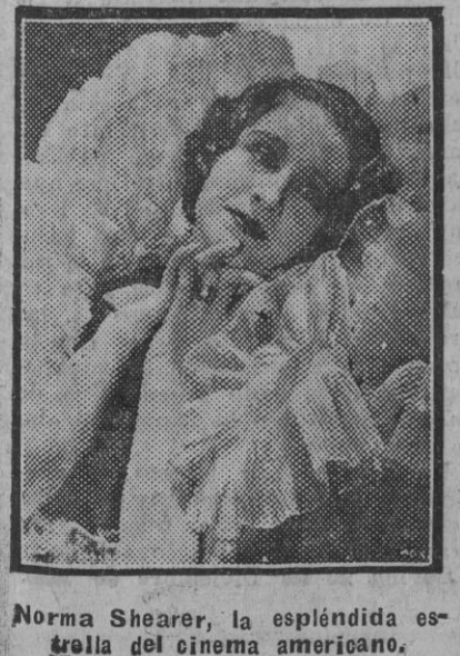
Norma Shearer, la espléndida estrella del cine americano.

Villanueva de la Serena 26.—El juez instructor por los sucesos acaecidos últimamente ha terminado sus actuaciones y marchó á Badajoz. Son siete los procesados que han sido conducidos esposados á la prisión Provincial acompañados de varias parejas de la Guardia civil. Entre aquellos se encuentran el ex alcalde Francisco Ferrón y el concejal conocido por El Pastorcillo.