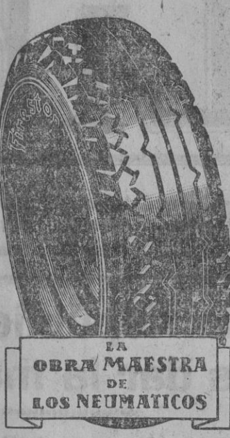
LA OBRA MAESTRA DE LOS NEUMATICOS

RECORDAMOS a los CONSUMIDORES de NEUMATICOS "FIRESTONE - HISPANIA", que TIENEN DERECHO durante todo el presente mes de Noviembre, AL REGALO DE UNA famosa CAMARA roja, REFORZADA, de fabricación nacional, POR CADA CUBIERTA "FIRESTONE HISPANIA" de igual medida, también nacional, QUE COMPREN