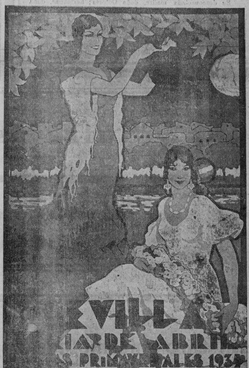
Cartel que ha merecido mención honorífica