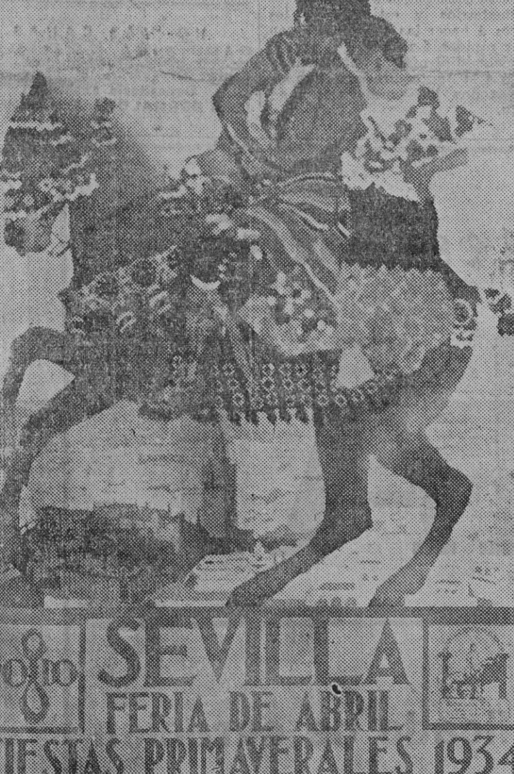
Cartel que ha obtenido el premio

Obras públicas, muchas obras públicas. Para restablecer y afianzar la paz en los espíritus, trabajo, trabajo y trabajo.