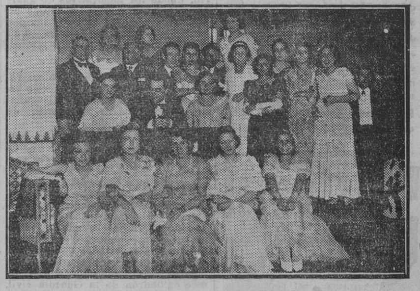
Madrid.—Acto celebrado en la Casa de Andalucía como remate de las fiestas de Mayo. (Edo. Gori.)