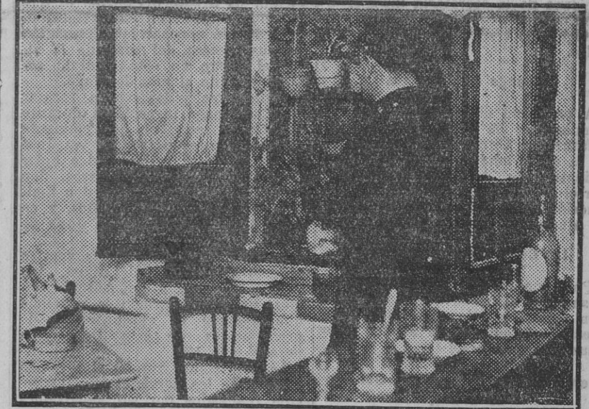
Interior de la taberna donde se consumó la agresión. (Edo. Gori.)

Dentro de la gravedad se encuentra muy mejorado.