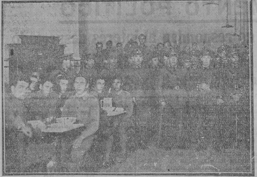
Acto inaugural del Hogar del Soldado en el batallón de zapadores número 2, celebrado ayer. (Edo. Gori)