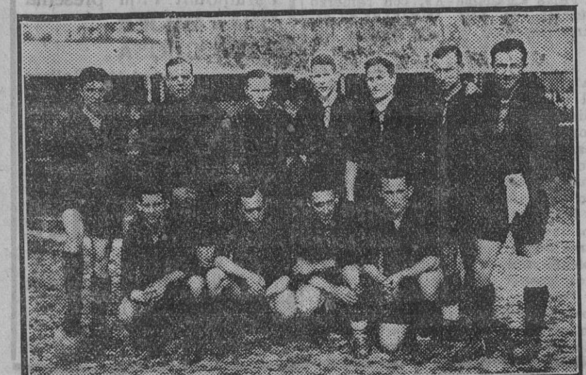
El equipo nacional, que hoy ha comenzado sus entrenamientos

Desearnos al querido amigo y admirado artista un viaje feliz y los progresos que merece por su inspiración y trabajos.