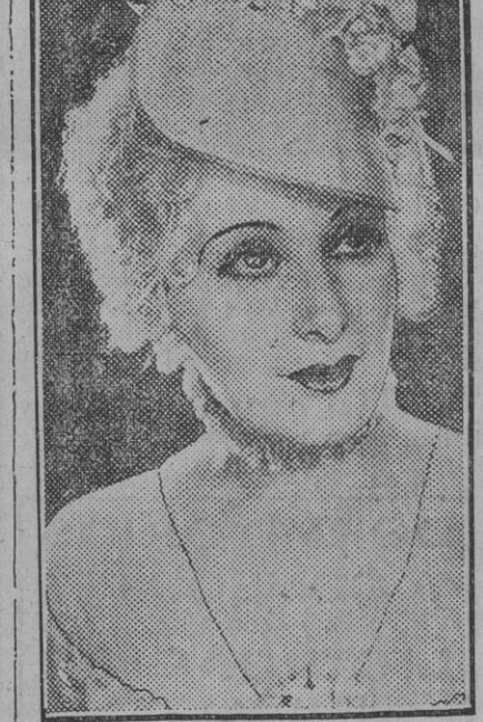
Lil Davover, una de las mujeres más bonitas del cine universal.