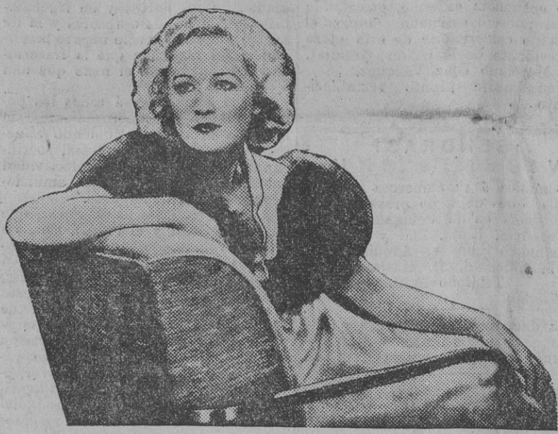
Mirian Hopkins tiene un par de ojos de los más bonitos de Hollywood.

El discurso de anoche del señor Azaña fué de los más sustanciosos que hasta ahora ha pronunciado. Severo; lleno de profundidad; sentido; es-