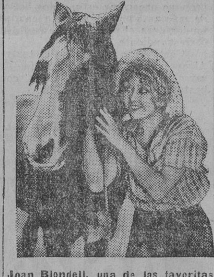
Joan Blondell, una de las favoritas del cine yanki, se deja sorprender por el fotógrafo en una «pose» propia de las vacaciones.