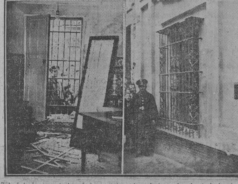
Vista interior y exterior de la secretaría instalada en la planta baja de la Casa del Pueblo, a donde alcanzaron los efectos de la explosión.

Quedo esperando a que nos visite el señor Azaña. Quedo esperando a que nos visite el señor Azaña.