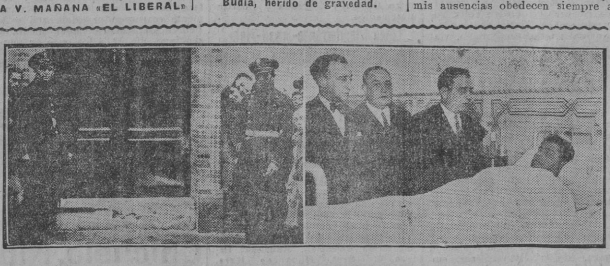
La casa de la calle Santa Ana, de la que fué arrancado el escalón de mármol, por efecto de la explosión.—El alcalde visitando a los heridos de anoche, hospitalizados.

Ministerio de la Guerra. Hoy ha tocado así. Un antedespacho. Otro antedespacho. Otro. Por fin pasamos al despacho de ayudantes. Los ayudantes del ministro de la Guerra son muy simpáticos, muy serviciales, muy comprensivos. Conocen al alcalde, conocen a Casas. No conocen al reportér y a los cinco minutos son nuestros amigos. ¡Muy simpáticos! Están en turno para ver al Presidente y ministro de la Guerra el alcalde de Zaragoza, un diputado a Cortes por Santander, don Honorato de Castro y el gran simpático doctor Coca, el hombre que está en todos partes. Despacha el Presidente en esos momentos con el jefe del Estado Mayor Central, luego con el director de Aeronáutica, señor Álvarez Builla; luego con don Honorato, que entró para dejar unos documentos y debe estar leyéndolos al Presidente, porque no sale nunca. Por fin... : : : Por fin entramos nosotros. Estamos ante el jefe del Gobierno. Tenemos ante el jefe del Gobierno. Tenemos ante el jefe del Gobierno. Tenemos ante el jefe del Gobierno. Tenemos ante el jefe del Gobierno. Tenemos ante el jefe del Gobierno. Tenemos ante el jefe del Gobierno.