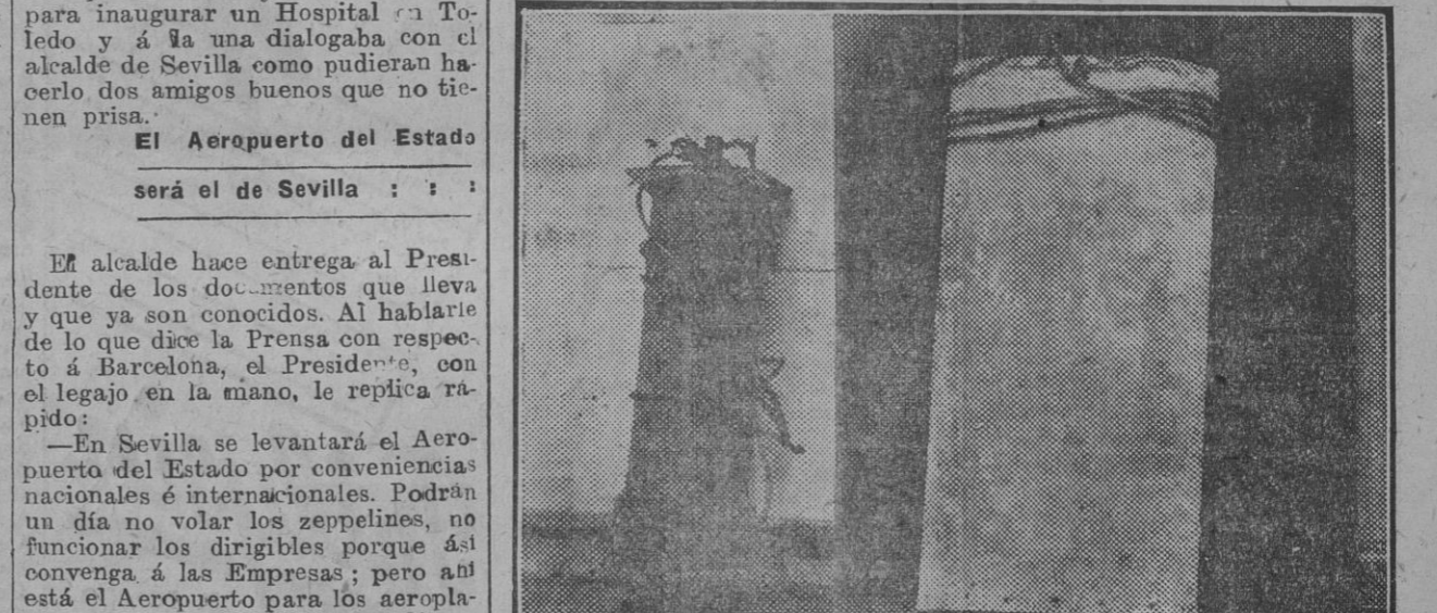
Las dos bombas, recogidas en el lugar del suceso, sin explotar.

Lindando con la Casa de Correos hay unos terrenos, solar hoy perteneciente a una Sociedad de Seguros. El alcalde interesa del jefe del Gobierno que el ministerio de la Guerra resuelva de una vez y se firme el oportuno documento de cesión total de esos terrenos para que las obras de edificación comiencen cuanto antes, máxime cuando la entidad que solicita esa prisa tiene terminados los planos y el alcalde no piensa más que en facilitar trabajo a los obreros del ramo de construcción. El Presidente, que conoce a dedillo el asunto, como lo demuestra en su charla con el alcalde, le contesta que vuelva al día siguiente a su despacho, donde uno de sus ayudantes, previamente enterado de lo que hay que hacer, firmará lo que haga falta para que las obras empiecen a la mayor brevedad posible. Las dos bombas, recogidas en el lugar del suceso, sin explotar. : : :