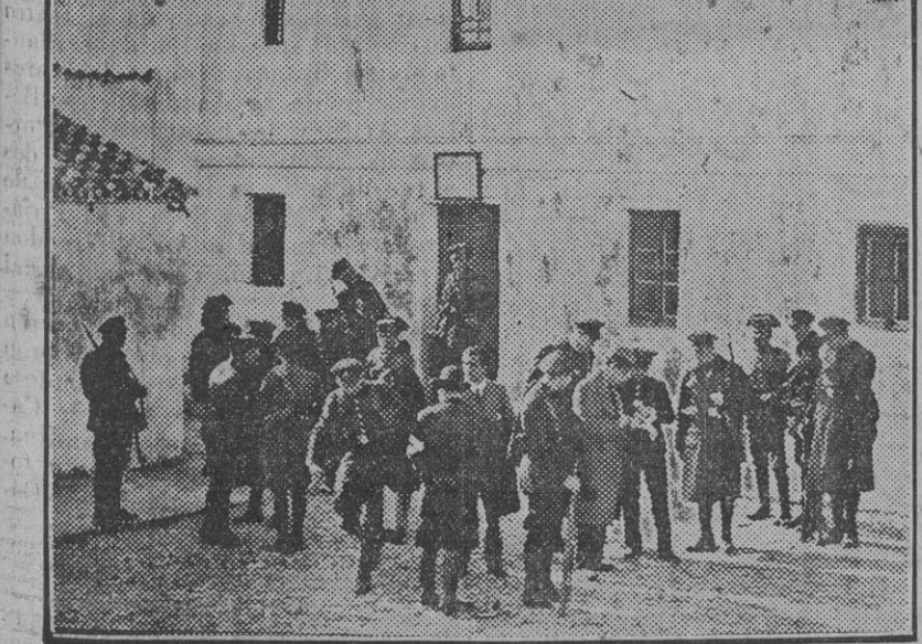
Fuerzas de Asalto y de la Guardia civil ante el cuartel tiroteado por los rebeldes en Casas Viejas

vil del puesto para que se entregase con sus fuerzas? Nadie acertó a confirmarnos la presencia en Casas Viejas de ningún agente provocador. Todas las influencias que pudieron determinar el desarrollo de los trágicos sucesos ya relatados se atribuyen a tres manifiestos que circularon con escasa diferencia de días y que excitaron los ánimos. Por otra parte, el alcalde pedáneo no recuerda a ninguno de los comisionados. Sólo que éstos eran numerosos y que actualmente faltan del pueblo no pocos vecinos. Como detalle que revela el sobrecogimiento de terror de los vecinos de Casas Viejas, al apuntar la mañana del 12, cuando al tableteo de las ametralladoras y a las explosiones de las bombas incendiarias hubo