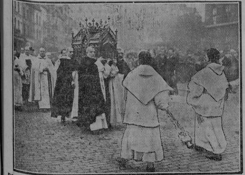
Reorganización de la Transatlántica francesa. Bruselas.—Los restos de San Alberto el Grande que, procedentes de Colonia, llegaron a dicha capital en procesión y a hombros de los padres dominicos, a quienes han sido confiados.

Berlín.—La Agencia Central anuncia que el cambio de Gabinete en Alemania no influirá para nada en la política exterior según por dicho país. Dicha agencia añade que, en efecto, el barón von Neurath continuará casi seguramente al frente del departamento de Negocios Extranjeros, sea cual fuere la composición del nuevo Gobierno.