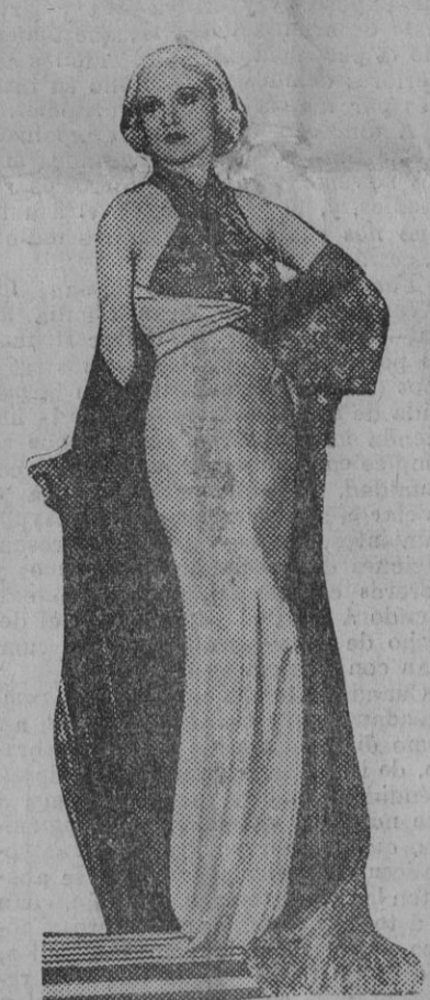
Carole Lombard, la más elegante de las actrices cinematográficas