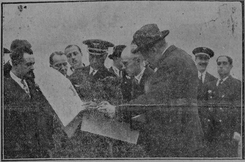
El doctor Eckener y el comandante Lehman, viendo los planos de emplazamiento del Aeródromo de Tablada. (Fdo. Sánchez del Pando.)

La visita a los terrenos de Tablada.—El banquete en el Casino Sevilla y el baile resultaron brillantísimos.