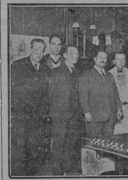
La representación municipal saludando al doctor Eckener, a su llegada al hotel. (Fotos Sánchez del Pando.) (Fdo. Gori.)

El alcalde, con una Comisión del Ayuntamiento, saluda en el hotel a los recién llegados: