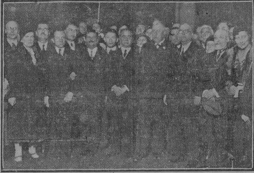
El ilustre aeronauta germano, a su llegada al Ayuntamiento, rodeado del elemento oficial y representaciones ciudadanas.