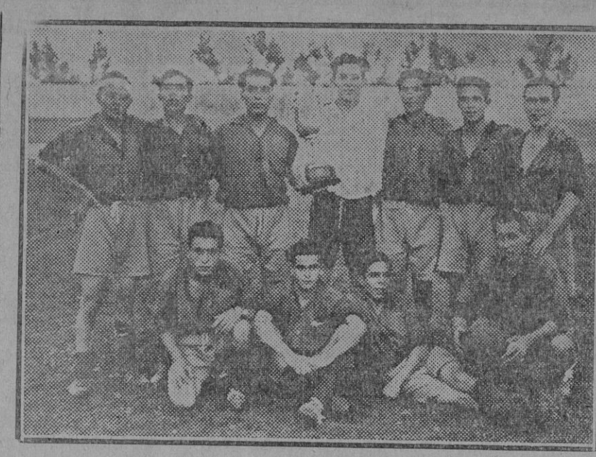
Equipo España F. C., ganador del campeonato de tercera categoría (Edo. Gori.)

Aprovechamos muy gustosos esta ocasión para mostrar nuestro agradecimiento por las facilidades y medios que nos han sido dados por el referido teniente de alcalde, a quien esta Directiva da públicamente las gracias y hace resaltar su favorable gestión cerca de los empleados y obreros municipales.