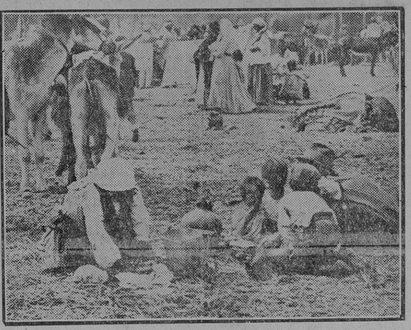
Una obligada escena del rodeo, en las primeras horas de la mañana.