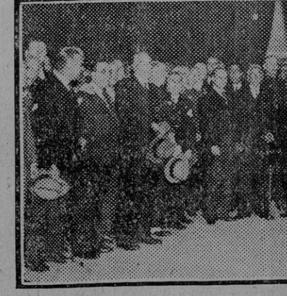
II Congreso Internacional de Otorinolaringología. Después de la sesión inaugural los delegados de todas las naciones aparecen reunidos rodeando al Presidente de la República.

De transacciones y precios, no sabemos una palabra. El primer día no se hace más que tantear. Ya mañana se empiezan a cerrar los tratos. Los gigantes parece que han visto con bastante agrado la sustitución de la Guardia civil por guardias de Seguridad a caballo.