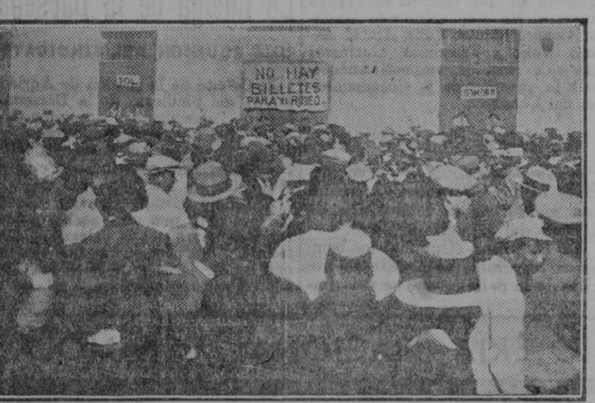
Con más elocuencia que cualquier información habla del éxito alcanzado por el moderno espectáculo que presenta Pagés ese cartelito colgado sobre la ventanilla expendedor de localidades: «No hay billetes para El Rodeo».

El domingo, día 8, ocurrirá lo propio en la plaza de la Maestranza.