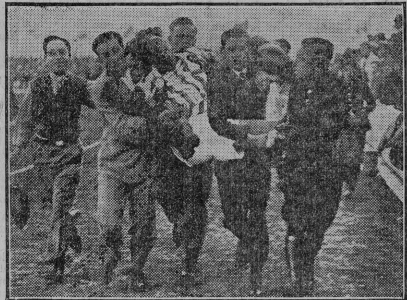
Peral á la enfermería (Fdo. Gori.)

Bajaban los delanteros para servirse ellos mismos, y cuando ante la puerta enemiga volvían la vista, buscando el apoyo de sus medios, se encontraban con que éstos no ha-