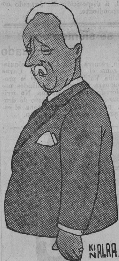
Alcalá Zamora pronunció un discurso, en el que dijo que, á pesar de no estar conforme con algunos artículos de la misma, es preciso acatar la como expresión de la mayoría del Parlamento.

Lo que dijo el señor Azafia en relación sobre la oferta hecha á Alcalá Zamora