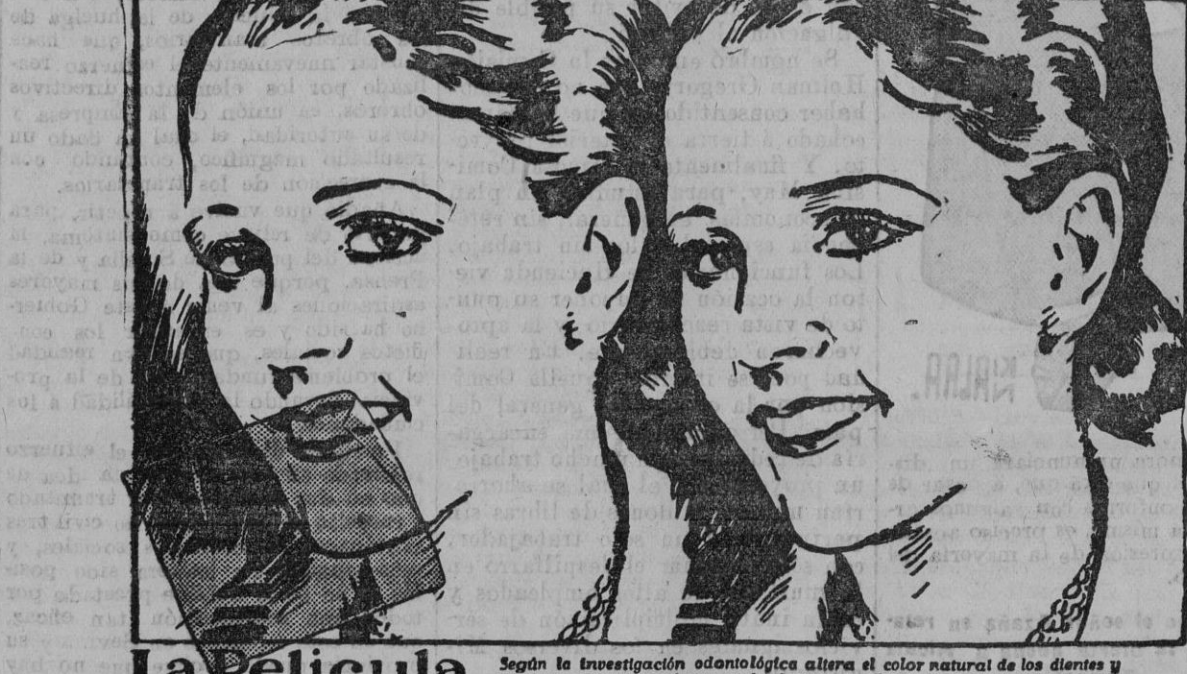
La Película Según la investigación odontológica altera el color natural de los dientes y provoca serios desórdenes en la dentadura. Debe combatirse diariamente.