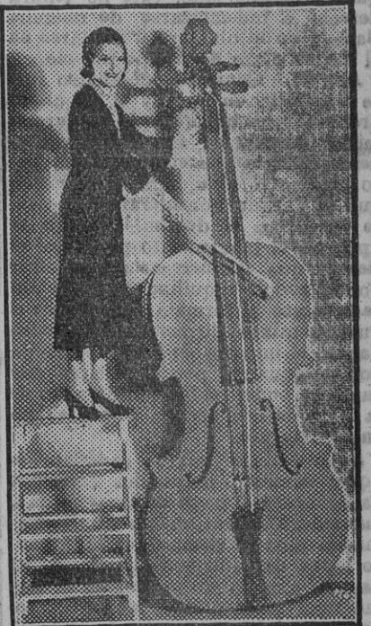
Astrid Alwynn, actriz sueca, prueba sus habilidades musicales en este violón gigante, que encontrará entre los extraños objetos que abundan en los estudios cinematográficos.