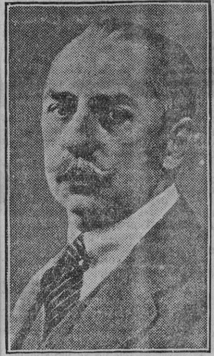
Don Jaime de Borbón y Borbón, duque de Anjou y de Madrid, pretendiente al Trono de España, fallecido ayer en París

Al darse lectura á una moción del Alcalde se entabló un apasionado debate sobre la Bolsa de Trabajo, provocándose un incidente entre dos ediles socialistas