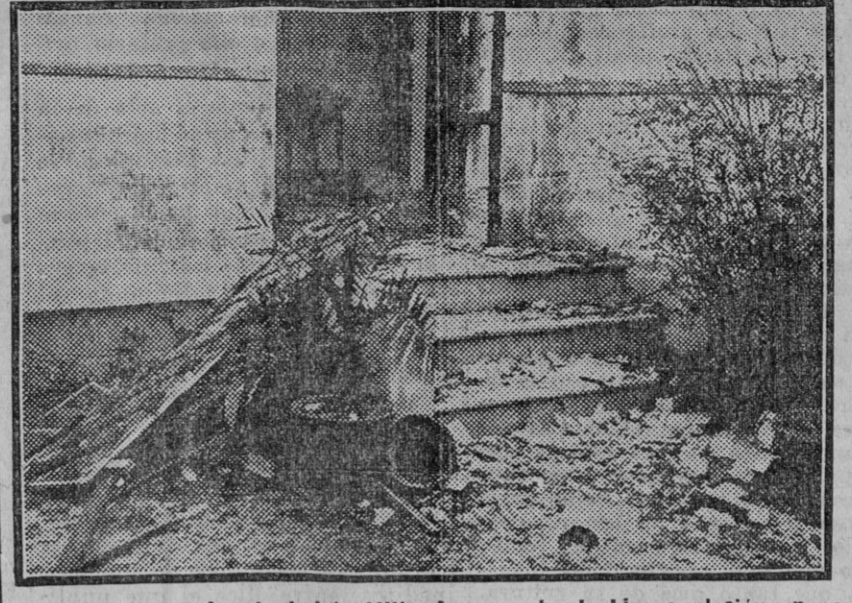
Puerta de entrada al chalet «Villa Laura», donde hizo explosión un petardo. (Fotografía obtenida después de la llegada del Juzgado.)

Fué colocado en el chalet Villa Laura, de la calle Progreso No han ocurrido desgracias personales