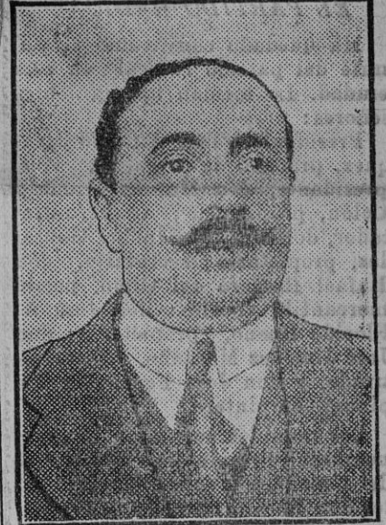
Don Agustín Bolde, sindaco presidente de la Bolsa de Madrid, que ha presentado la dimisión de su cargo.