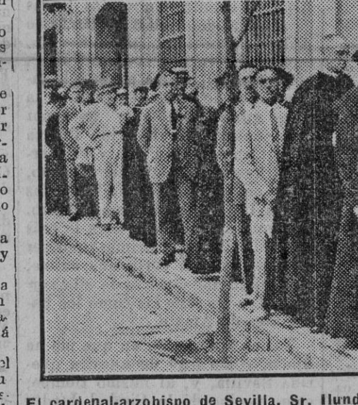
El cardenal-arzobispo de Sevilla, Sr. Llundain, guardando turno en la cola para emitir su sufragio en el colegio de la Plaza de la Contratación

Desde la Audiencia nos trasladamos al colegio de la calle Vida, donde en las elecciones pasadas emitió su voto el cardenal Llundain.