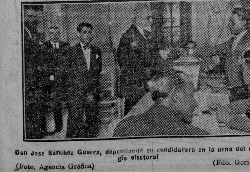
Don José Sánchez Guerra, depositando su candidatura en la urna del colegio electoral

Nosotros hicimos el primer recorrido por el barrio de Triana, donde el reporter hubo de formar cola durante un cuarto de hora, al sol, en la puerta del Colegio en que le correspondía emitir su sufragio.