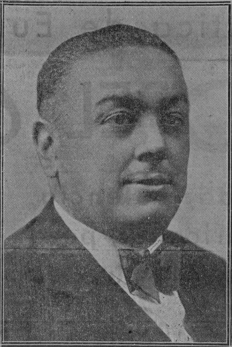
Don Diego Martínez Barrios, primer ministro de Comunicaciones

Por el proyecto, ya redactado, Sevilla, como capital de más de cien mil almas, constituirá una sola circunscripción con los pueblos que ya tenía agregados a ella en la antigua división electoral y los demás pueblos de la provincia, que antes aparecían agrupados en distritos unipersonales.