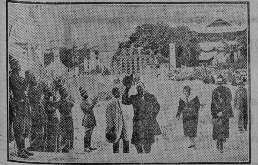
LA EXPOSICION COLONIAL EN PARIS

Aquellos que prefieran seguir con los sueldos del antiguo escalafón, quedan en libertad de hacerlo.