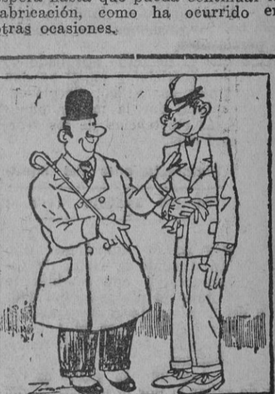
DON FULANO: «Has visto el anuncio del nuevo coche?»