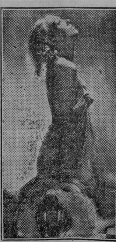
He aquí la fascinadora belleza de la estrella del film Edwina Booth, tan admirada por todos los públicos.

Representa nuestra foto el momento de la visita de Mr. Brevié, gobernador del Africa Occidental francesa al pabellón en obras de este territorio.