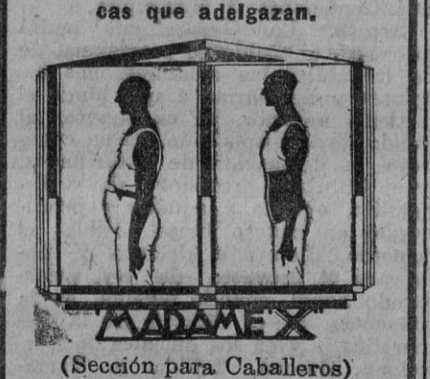
(Sección para Caballeros) Francos, 21 - Amor de Dios, 40

FAJAS DE CAUCHOLINA "Madame X" Para Caballeros. - Son las únicas que adelgazan.