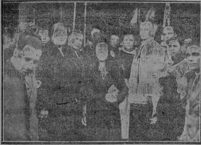
La infanta doña María Luisa de Orleans con su hija la princesa María de los Dolores de Borbón, al salir de la iglesia de San Jacinto, después de los cultos celebrados en honor de la Virgen de la Esperanza

En el templo de San Jacinto se celebró ayer mañana la función principal que la Hermandad de Nuestro Padre Jesús de las Tres Caídas y Nuestra Señora de la Esperanza dedica a la Santísima Virgen.