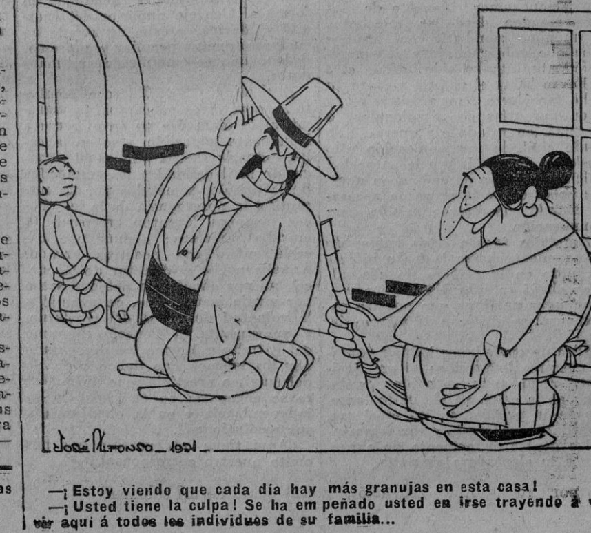
— Estoy viendo que cada día hay más granujas en esta casa! — Usted tiene la culpa! Se ha em peñado usted en irse trayendo á v... aquí á todos los individuos de su familia. —

Atanís 10.—Las fuerzas vivas de este pueblo protestan ante las autoridades del hecho de haber sido designada para desempeñar la Alcaldía persona incompetente y falta de las condiciones legales exigibles para ocupar el citado cargo.