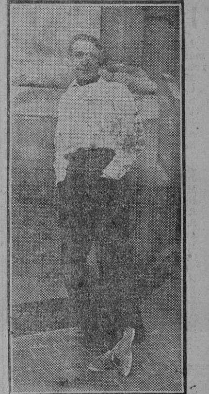
El escalator Becker, que ayer hizo una demostración en el Paseo de Recoletos (Foto. Agencia Gráfica, Fdo. Gori).

El recargo de los derechos arancelarios durante la segunda decena de este mes. Madrid 10.—La «Gaceta» publica una real orden señalando el recargo que se debe cobrar en las Aduanas durante la segunda decena del mes actual por las mercancías importadas y exportadas, cuyo pago se efectúe en monedas de plata ó billetes del Banco. Dicho recargo será de 89 enteros y 74 céntimos por ciento.