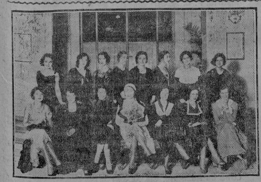
PARIS.—Las reinas de la belleza de las naciones europeas, reunidas para celebrar el concurso en que ha de elegirse á Miss Europa 1931.

expresión popular, decidió comunicarla á sus superiores las sospechas que abrigaba. El servicio de captura : : : —Mientras se llega á «ciudadanos científicos», los oligarcas harán mangas y capirotes. Y habrá política. Y políticos sin poder.