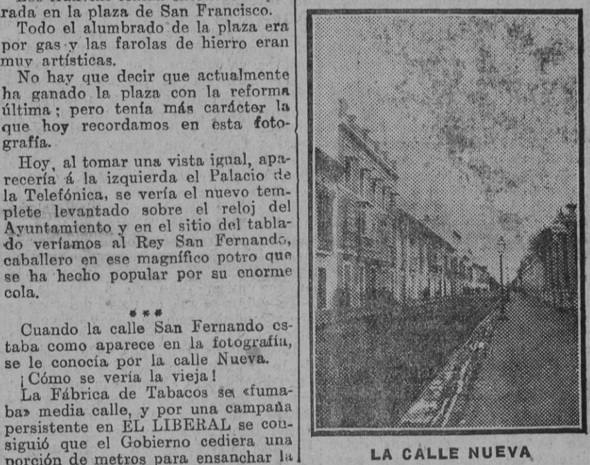
LA CALLE NUEVA

Esa es la Plaza Nueva, antes que San Fernando la tomara á caballo. Poseemos otra fotografía con un tablado para la música todavía más antiguo que este, que estaba donde aquí se levanta.