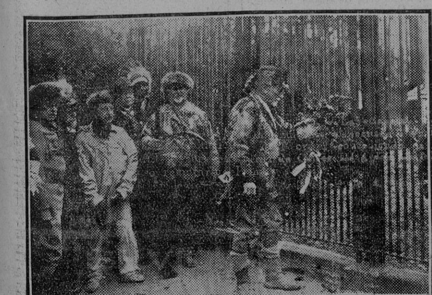
NEW YORK.—Los Boy Scouts realizando su anual peregrinación ante la tumba de Teodoro Roosevelt en Oyster Bay. (Foto. Agencia Gráfica.) (Fdo. Gori.)

A su viuda, hijos, padres y demás familia enviamos la expresión de nuestra condolencia.