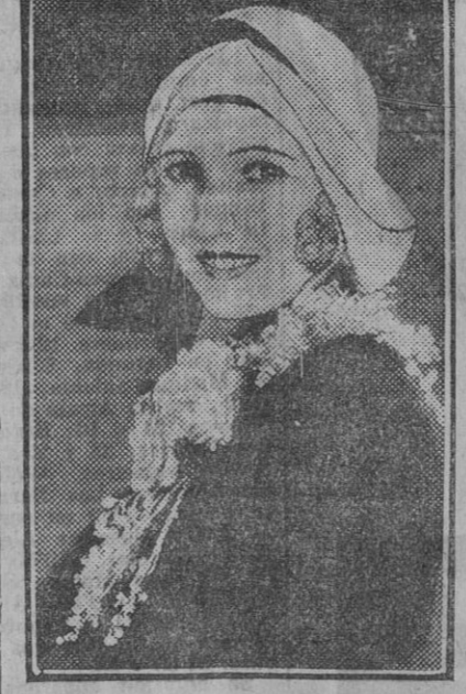
Elly Beinhorn, aviadora alemana que se dirige en avioneta a Africa.

á un accidente sin consecuencias. En pleno vuelo sobre el pueblo de Llerena, un engrase de bujías la obligó a tomar tierra cerca de la estación, haciendo el aterrizaje sobre terreno blando, de modo feliz.