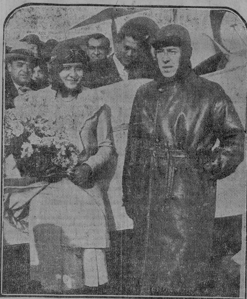
BARCELONA.—La reina de las modistas dispuesta a subir al avión en el que se celebró su bautismo del aire.

El señor Cambó terminó su conversación con los periodistas manifestando que dentro de pocos días regresaría de nuevo a Madrid y ofreciendo recibir a los periodistas siempre que tuviese noticias o opiniones que comunicarles.