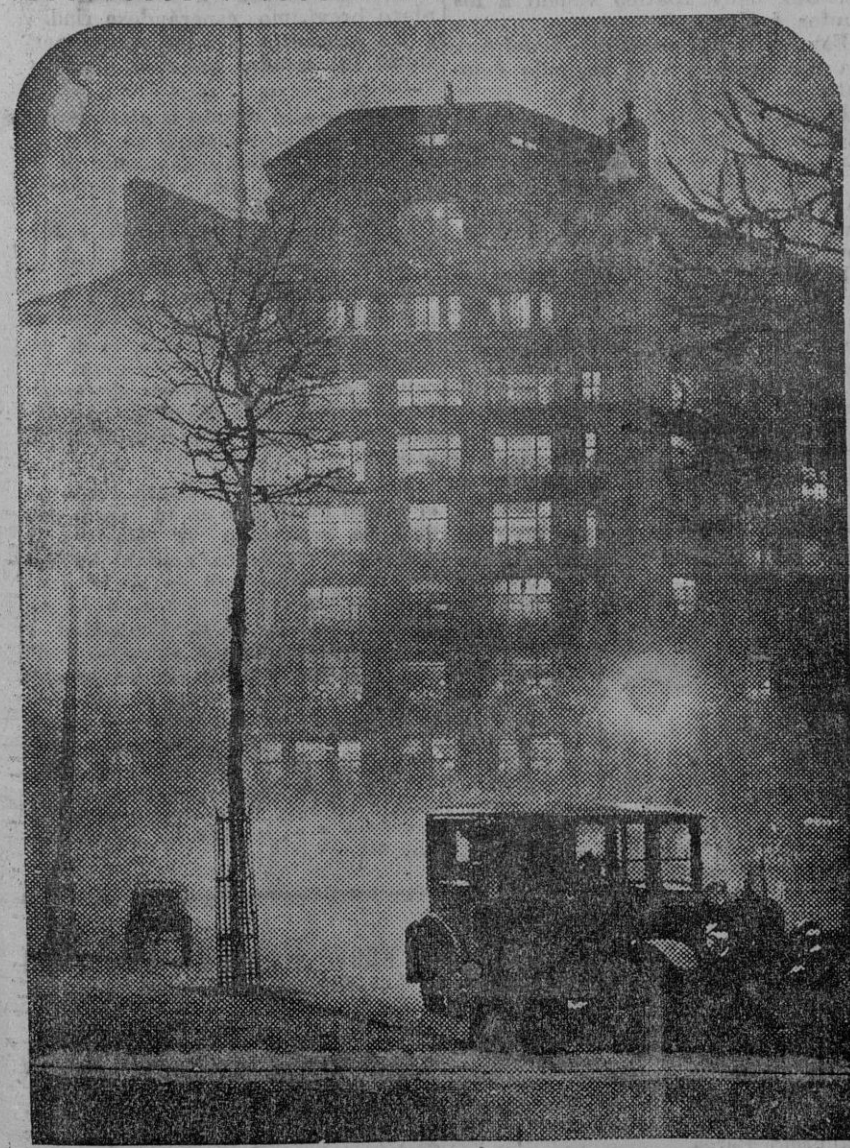
LONDRES.—Escenas de la ciudad bajo la niebla, que aparece de día lo mismo que de noche. Representa la foto Aldwyoh, á las once y media de la mañana