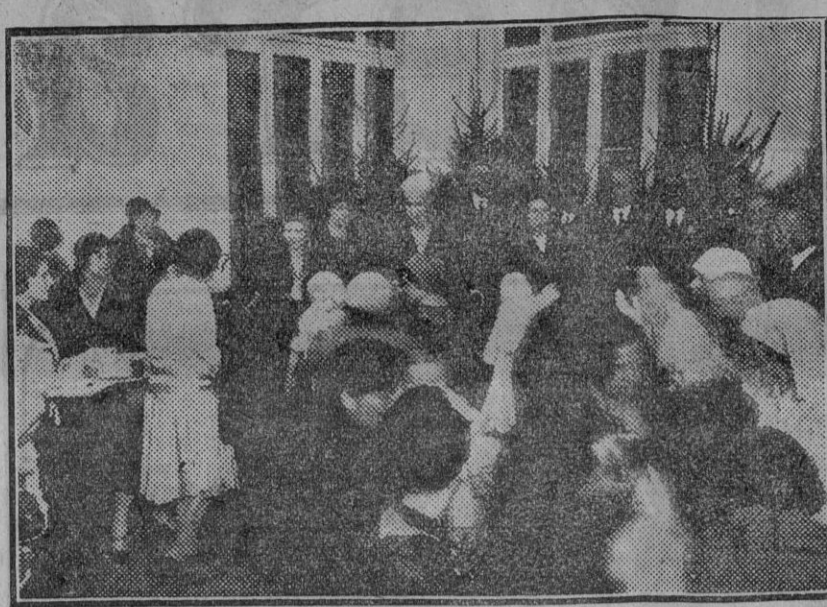
TURIN (ITALIA).—La princesa María José, hija de los Soberanos de Bélgica y esposa del príncipe Humberto de Piemonte, heredero del Trono de Italia, ofreciendo trajes a los niños pobres de los Centros Católicos de la ciudad