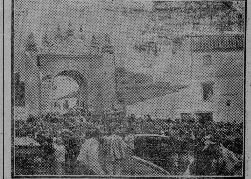
El entierro del Espartero, en la Macarena.