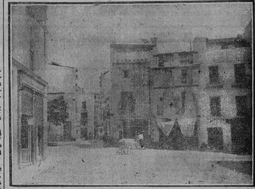
La casa de la Alfalfa, esquina á Odreros, donde nació Manuel García.

EN UNA ESPARTERIA LLO- RA UN CHIQUILLO... : Nada queda ya en la Alfalfa de aquella época. Las dos esquinas que ahí se ven han sido reedificadas. Ya de la espartería donde lloró un chiquillo, no queda nada. Ni siquiera una lápida conmemorativa, que indicara al turismo que en aquel recinto vivió la luz primera, el más valiente de los toreros. ¡No queremos fomentar el turismo! En la casa de esquina nació el que luego fué famoso diestro Manuel García (El Espartero), el torero más valiente que ha conocido «Don Criticón», quien fué íntimo del diestro sevillano. El mariscal volvió á la pesca de truchas en su pueblecito catalán. Desde entonces Joffre ha vivido la historia contemporánea de Francia sólo como testigo. Creyó su papel terminado cuando hizo buena su promesa de «no pasarán». Y ahora, al desaparecer para siempre del mundo de los vivos para dejar grabado su nombre en las páginas de la historia, de Francia con caracteres imborrables, vuelven á recordarse aquellas días de angustia en París, cuando Joffre, llamado por el Gobierno para encargarse del mando, hizo del Marne un símbolo nimbado por la gloria del pueblo, que supo imponerse y abatir las aguas que parecían invencibles del ejército germano.