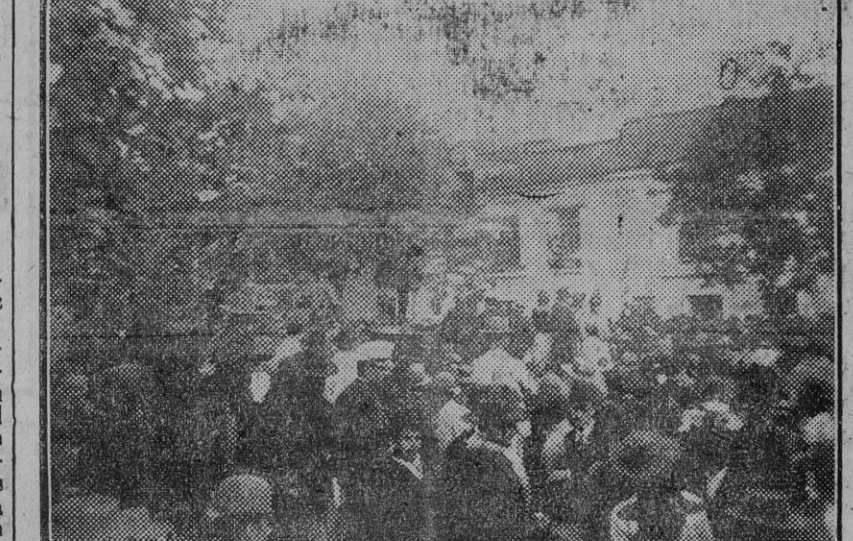
La carroza fúnebre pasando por la calle Andueza, á buscar el hoy camino viejo del Cementerio, que antes era el indicado para hacer el último viaje.

EN UNA ESPARTERIA LLO- RA UN CHIQUILLO... : Nada queda ya en la Alfalfa de aquella época. Las dos esquinas que ahí se ven han sido reedificadas. Ya de la espartería donde lloró un chiquillo, no queda nada. Ni siquiera una lápida conmemorativa, que indicara al turismo que en aquel recinto vivió la luz primera, el más valiente de los toreros. ¡No queremos fomentar el turismo! En la casa de esquina nació el que luego fué famoso diestro Manuel García (El Espartero), el torero más valiente que ha conocido «Don Criticón», quien fué íntimo del diestro sevillano. El mariscal volvió á la pesca de truchas en su pueblecito catalán. Desde entonces Joffre ha vivido la historia contemporánea de Francia sólo como testigo. Creyó su papel terminado cuando hizo buena su promesa de «no pasarán». Y ahora, al desaparecer para siempre del mundo de los vivos para dejar grabado su nombre en las páginas de la historia, de Francia con caracteres imborrables, vuelven á recordarse aquellas días de angustia en París, cuando Joffre, llamado por el Gobierno para encargarse del mando, hizo del Marne un símbolo nimbado por la gloria del pueblo, que supo imponerse y abatir las aguas que parecían invencibles del ejército germano.