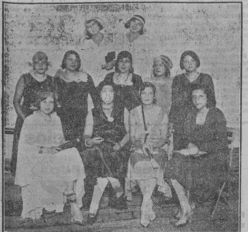
Las principales partes del elenco femenino que actuará en el teatro del Duque la próxima temporada.