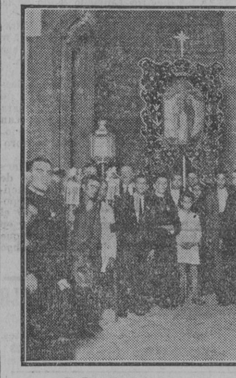
El Rosario del Voto, que salió anoche de la Basílica