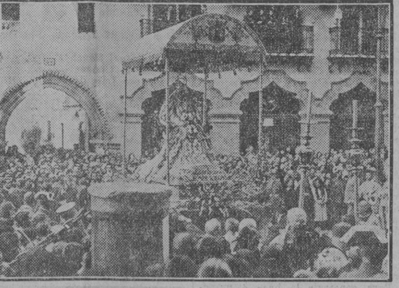
La imagen de la Patrona de Sevilla, a su entrada en la Catedral

Desde las cinco de la mañana numerosos fieles ocupaban las naves de la basílica. A las siete se dijo una misa cantada ante el «paso» de la Patrona de Sevilla. El Cabildo Catedral, con cruz alzada, marchó al Palacio Arzobispal, recogiendo al prelado, trasladándose a la capilla real. Seguidamente se organizó la procesión, que salió a las ocho. La plaza del Cardenal Lluich aparecía abarrotada de público, Fuerzas de Seguridad y de la Guardia civil mantenían el orden. Abrió marcha en la comitiva una sección de guardias de Seguridad de a caballo. A continuación la Hermandad de Nuestra Señora de los Reyes y la Sacramental del Sagrario. Cruces parroquiales y Universidad de curas párrocos; tras éstos el Cabildo Catedral y los capellanes reales señores Nogueras, Ponce de León, Ballesteros y Piña, con el «paso» de la Virgen. La milagrosa imagen lucía ricamente blanca, bordado con castillos y leones de oro, regalo de la Reina Isabel II. Sobre la rica peana de plata, regalo de las señoritas de León Armero, lucían numerosas varas de narros y azucenas. Escotaban el «paso» los gastadores del regimiento de Granada y Fuerzas de Seguridad. Al aparecer la Virgen de los Re-