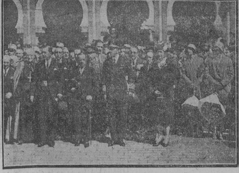
Los Reyes presenciando el desfile de las fuerzas que rindieron honores en la estación.

En automóvil ha venido el Infante Don Fernando de Baviera.-El "Conde Zeppelin" ha salido hoy á las dos de la tarde y llegará mañana á las diez