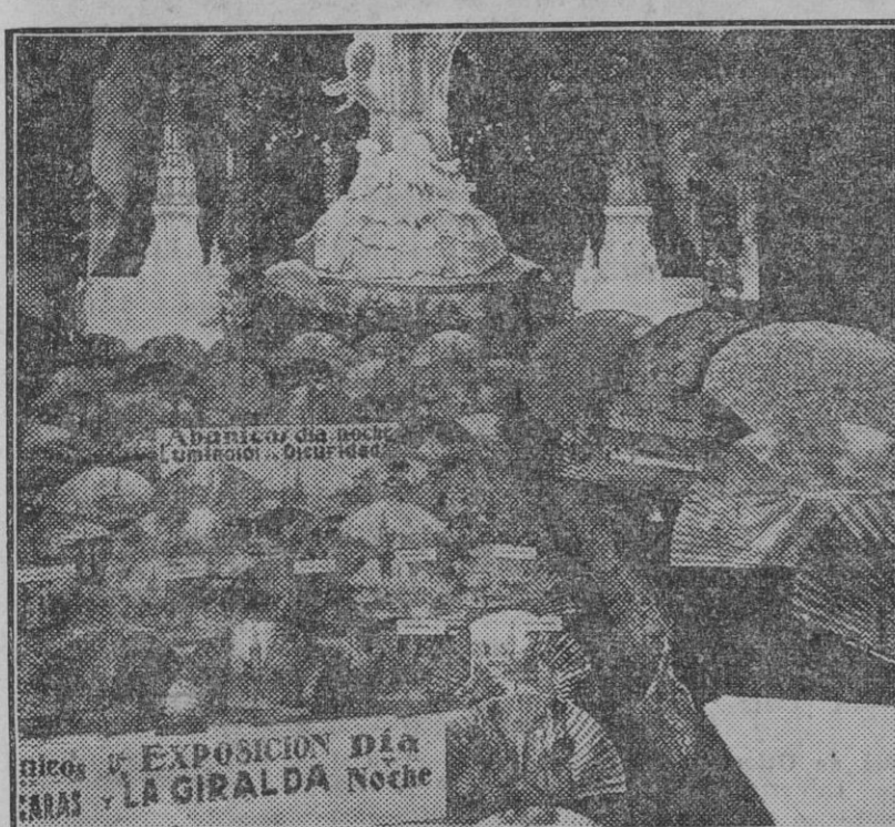
ABANICOS LUMINOSOS.—Exposición de la Casa Rubio el pasado Domingo 23. NOVEDAD 1930.—Abanicos de gran efecto en la obscuridad donde se transforman de día en noche, merced á unos colores fosforescentes semejanza de las iluminaciones de la Giralda y el Parque.—Modelos Gran Moda. CASA RUBIO.—Sierpes, 66

Todas las cualidades de un ex- celente postre las reúne DULCE DE VENDIMIA Tiene además una cualidad única. Está elaborado con ZUMO DE UVAS ANDALUZAS De venta en Ultramarinos.