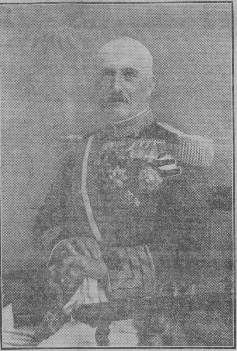
S. A. R. el Infante D. Carlos de Borbón y Borbón, Capitán General del Ejército, nombrado para desempeñar la Capitanía General de la 4.ª Región (Cataluña)...