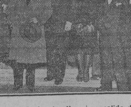
Congresistas del primero Nacional del Aceite de oliva, á su salida del pabellon de los Estados Unidos