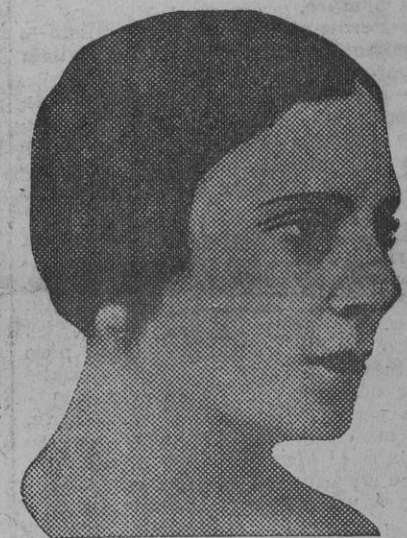
La ilustre actriz argentina Camila Quiroga, que viene haciendo una brillantísima campaña de arte en el teatro de la Exposición y que esta noche celebra su beneficio.

Madrid 11.—El conde de Romanones estuvo ayer en el domicilio del escultor Benlliure para firmar en el busto que por encargo de la Sociedad «Hispania de Nueva York» le ha sido confiado ejecutar.