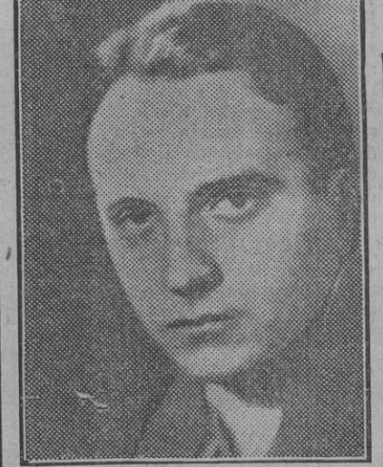
El eminente pianista Roberto Casades, que ayer obtuvo resonante triunfo en la Sociedad Sevillana de Conciertos.